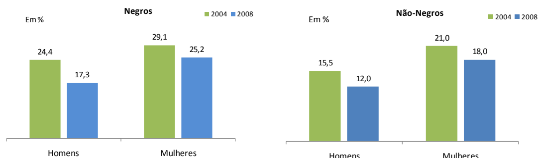
Gráfico 3 Taxas de Desemprego, por Sexo, segundo Raça/Cor Região Metropolitana de Salvador 2004-2008

Fonte: SEP. Convênio Seade – Dieese e MTE/FAT e Parceiros Regionais: SEI/SETRE/UFBA. Pesquisa de Emprego e Desemprego – PED.