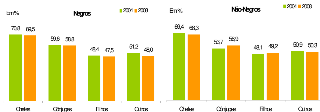
Gráfico 2 Taxas de Participação, por Posição no Domicílio, segundo Raça/Cor Região Metropolitana de Porto Alegre 2004 e 2008