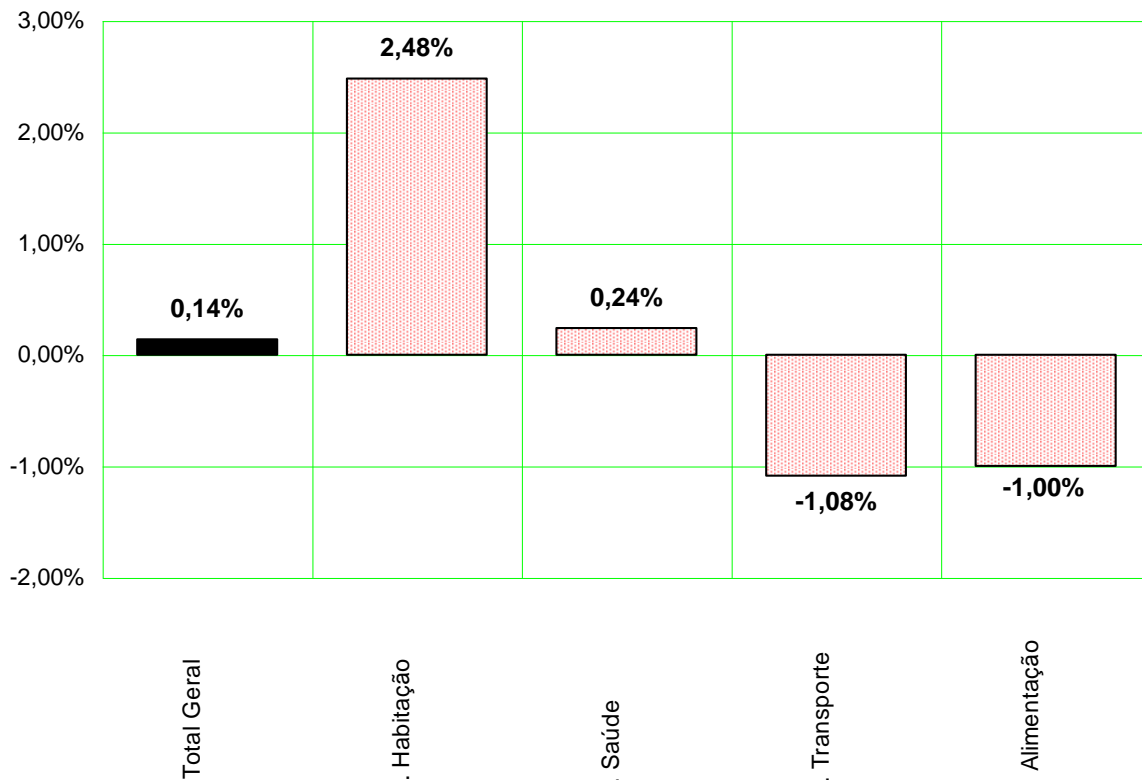
GRÁFICO 1 Índice do Custo de Vida (ICV-DIEESE) Taxas dos grupos Município de São Paulo – Julho de 2018