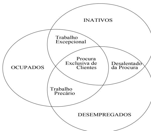
FIGURA 1 Fronteiras na condição de atividade em mercados de trabalho heterogêneos

Essa realidade requer instrumental adequado para compreensão de suas características, principalmente no que diz respeito às formas alternativas de inserção produtiva e subutilização da força de trabalho.